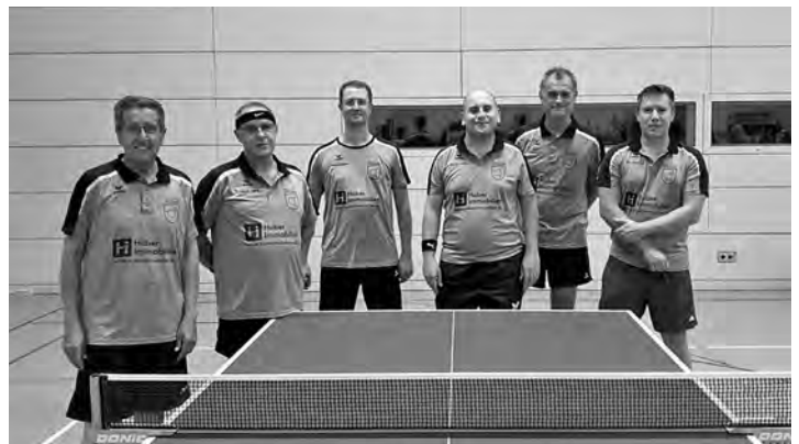
Meistermannschaft der Herren 3