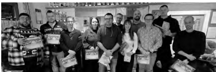
Oben: Ehrungen der Castingsportler.