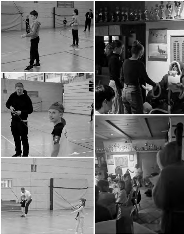
Linke Seite: Auftakt in der Sporthalle.

runde bedeutete. Den Abschluss machte eine Runde Hockey, bei der alle Altersklassen in gemischten Teams voll mitmischten.