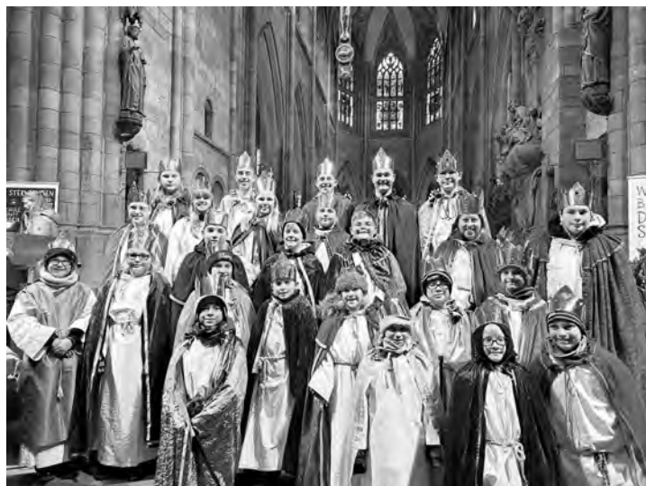
Die Iffezheimer Sternsinger im Freiburger Münster

Am 30. Dezember fand in Freiburg die bundesweite Eröffnung der „Aktion Dreikönigssingen 2026“ statt. Aus Iffezheim nahmen 30 Königinnen und Könige daran teil.