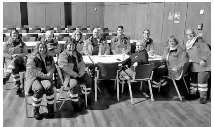
Unsere Mannschaft in Warteposition in der Badner Halle

Dank der hervorragenden Zusammenarbeit mit dem Ortsverein Plittersdorf und dem Krisennotfallteam sowie den Mitarbeitern der BadnerHalle konnte der Einsatz reibungslos ablaufen.