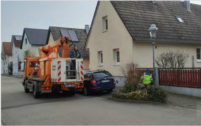
Das Bild zeigt die Montagearbeiten im Bereich der Sternstraße.

Im vergangenen Dezember erfolgte bereits die Umstellung der technischen Straßenlampen auf LED. In dieser Woche konnte nun mit der Umrüstung der historischen Straßenlampen begonnen werden. Hauptsächlich befinden sich diese im Wohngebiet „Gute Morgenmatt“ sowie im Ortskern. Die Montage der historischen Lampenaufsätze wird von den Stadtwerken Baden-Baden ausgeführt.